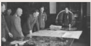
Краткий курс истории. План «Барбаросса»