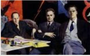
Кукрыниксы – художники Победы