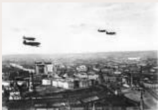
Как Кремль прятали от фашистов