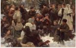
Война войной, а обед по расписанию: что ел советский солдат