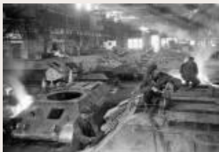
Краткий курс истории. Завод – передовик революции