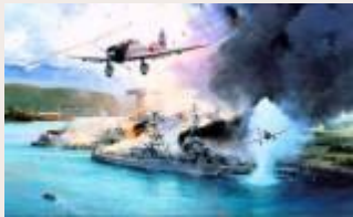
Краткий курс истории. Трагедия Жемчужной гавани