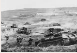
Краткий курс истории. Отец танка Т-34