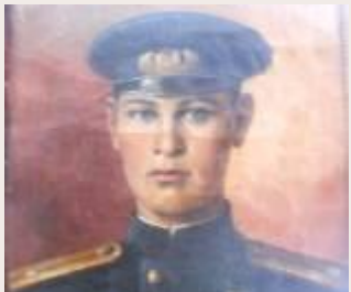
Отдавший жизнь за Крым