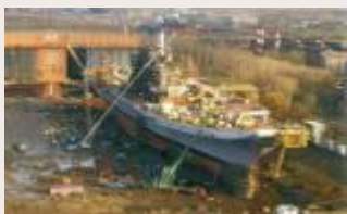
Краткий курс истории. Завод № 402